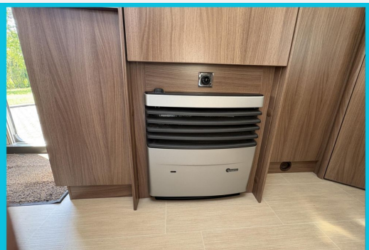
Seit 1987 am Baver Seite Seit 1987 am Baver Seite