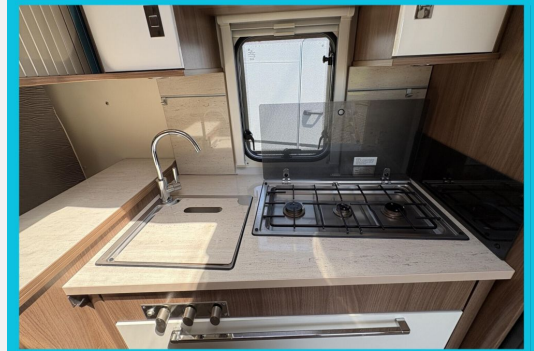
Seit 1987 am Baver Seite Seit 1987 am Baver Seite