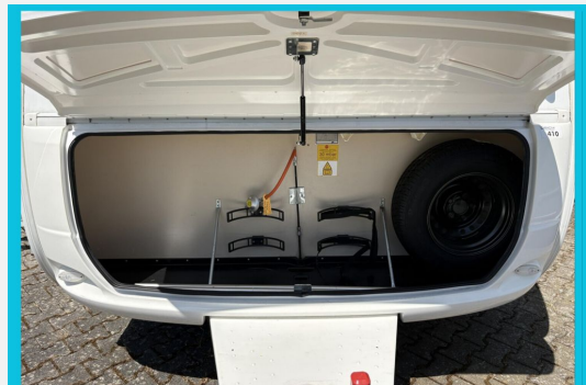
Seit 1987 am Baver Seite Seit 1987 am Baver Seite