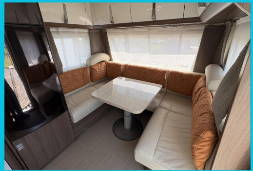
Seit 1987 am Baver Seite Seit 1987 am Baver Seite