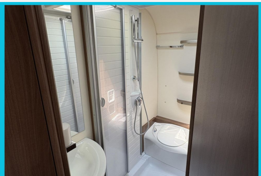
Seit 1987 am Baver Seite Seit 1987 am Baver Seite