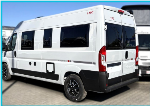
Seite 1987 von 1989 Seiten