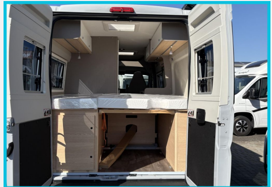
Seite 1987 von 1989 Seiten