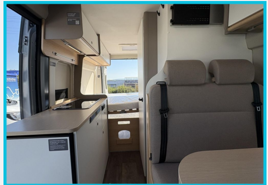
Seite 1987 von 1989 Seiten