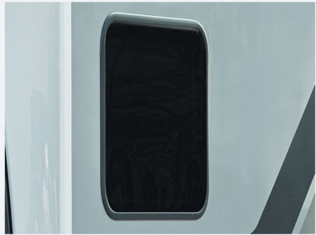
Rahmenfenster SEITZ S7P