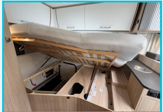
Seit 1987 an Ihrer Seite