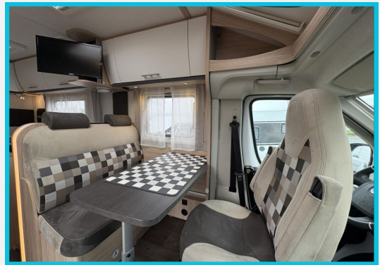
Seite 1987 von 1989 Seiten