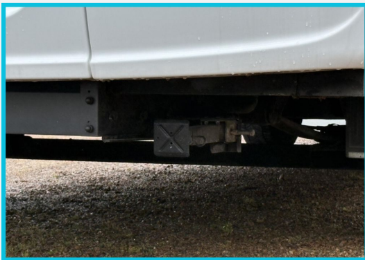
Seite 1987 von 1989 Seiten