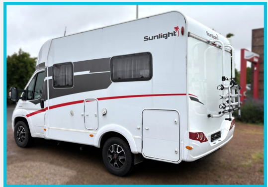
Seite 1987 von 1989 Seiten