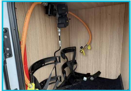
Seite 1987 von 1989 Seiten