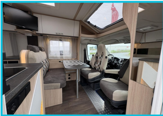
Seite 1987 von 1989 Seiten