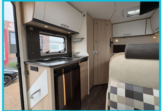
Seit 1987 an Ihrer Seite