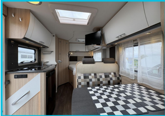
Seit 1987 an Ihrer Seite