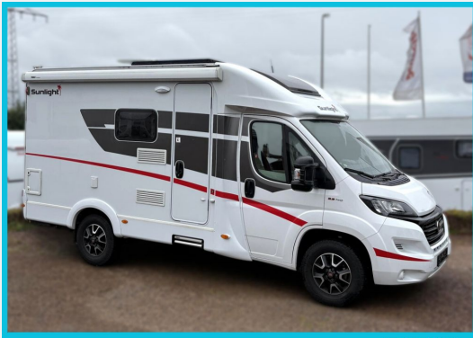
Seite 1987 von 1989 Seiten