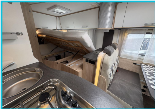
Seit 1987 an Ihrer Seite