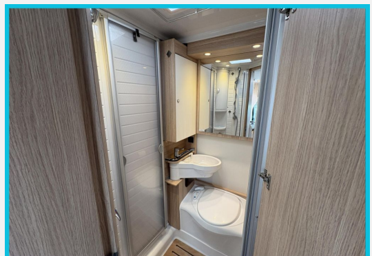
Seit 1987 an Ihrer Seite