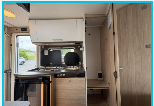
Seit 1987 an Ihrer Seite