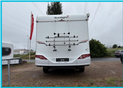
Seite 1987 von 1989 Seiten