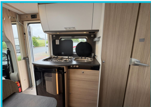
Seit 1987 an Ihrer Seite