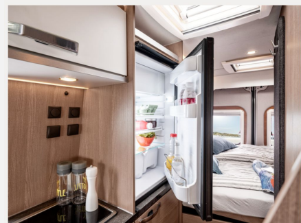
Kompressor-Kühlschrank 95 Liter, energieeffizient (incl. 12,8 Liter Gefrierfach)