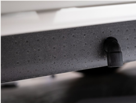
Isolierhaube Abwassertank, beheizbar