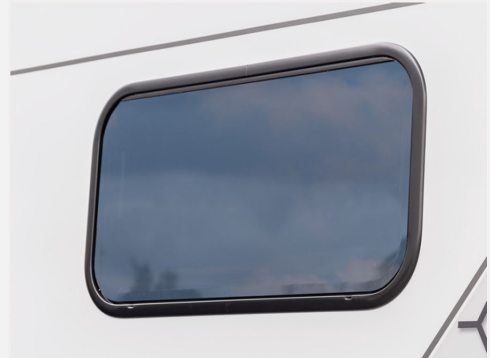
Rahmenfenster SEITZ S7P