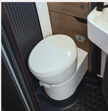
Kassetten-Toilette THETFORD drehbar