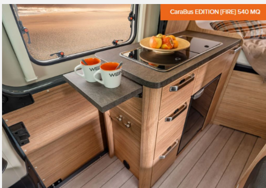
CaraBus EDITION [FIRE] 540 MQ