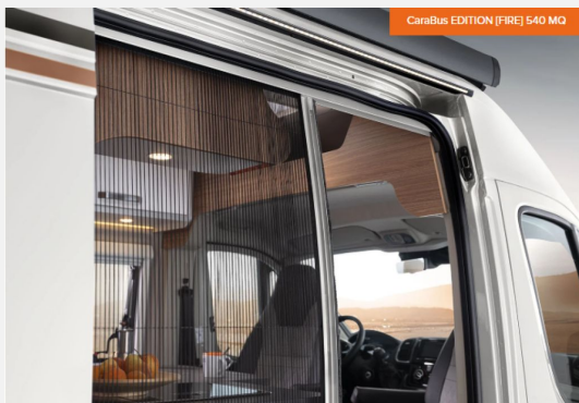
CaraBus EDITION [FIRE] 540 MQ