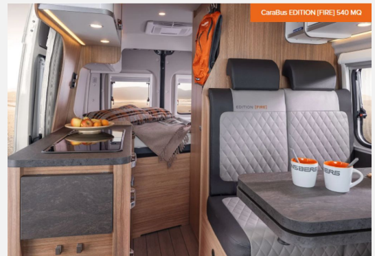
CaraBus EDITION [FIRE] 540 MQ