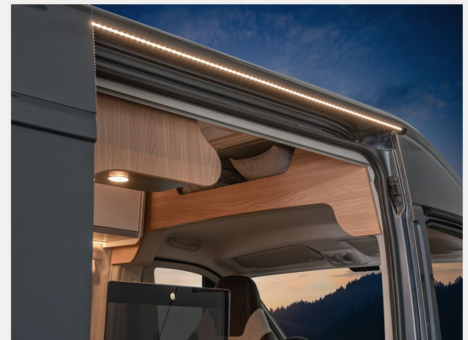
Regenrinne über der Schiebetür mit LED (dimmbar)