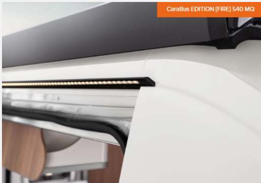
CaraBus EDITION [FIRE] 540 MQ