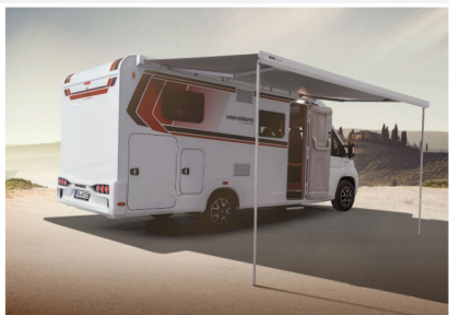
Immer gut geschützt: Die serienmäßige Markise macht Deinen Urlaub noch angenehmer.