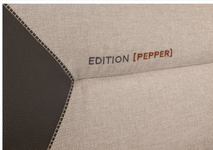
Strapazierfähig: Der exklusive Active-Line Polsterstoff MALABAR in Kunstleder-Stoffkombination und besonderer Ziernaht.