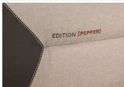
Strapazierfähig: Der exklusive Active-Line Polsterstoff MALABAR in Kunstleder-Stoffkombination und besonderer Ziernaht.