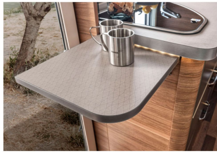
Klappbare Arbeitsplattenverlängerung. Die praktische Verlängerung mit Einhandbedienung schafft zusätzliche Arbeitsfläche.