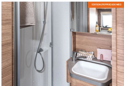
Alles was man zum Erfrischen braucht, in einem Raum vereint. Mit praktischer Duschwand und ästhetischer LED-Beleuchtung.