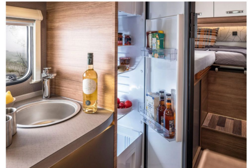
Da geht ordentlich was rein. SlimTower Kühlschrank mit 142 Liter.