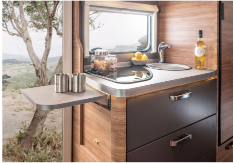
Küche mit klappbarer Arbeitsplattenverlängerung.