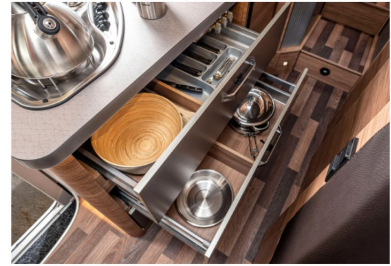
Hochwertiger kugelgeführter Auszug mit Soft-Close, mit Besteckeinsatz.