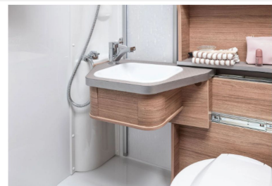
Das platzsparende Waschbecken kann je nach Bedarf hin- und hergeschoben werden.