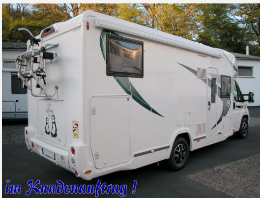
im Kundenauftrag !