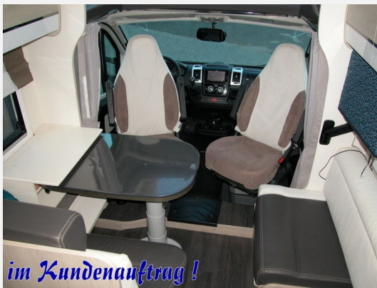
im Kundenauftrag !