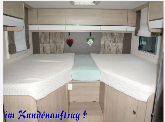
im Kundenauftrag !