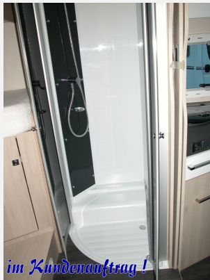
im Kundenauftrag !