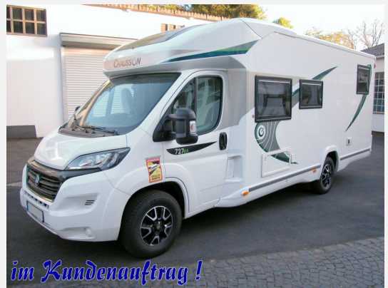
im Kundenauftrag !