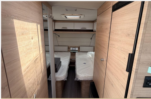
gérard Caravaning 08803 / 63 64-0 info@wohnwagen-gerard.de KNAUS WEINBERG INTER CARAVANNING RENT & TRAVEL FENDT CARAVAN