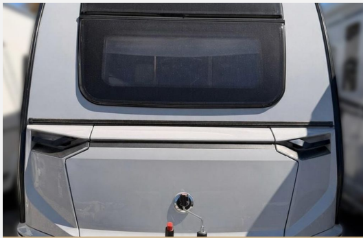
gérard Caravaning 08803 / 63 64-0 info@wohnwagen-gerard.de KNAUS WEINBERG INTER CARAVANNING RENT & TRAVEL FENDT CARAVAN