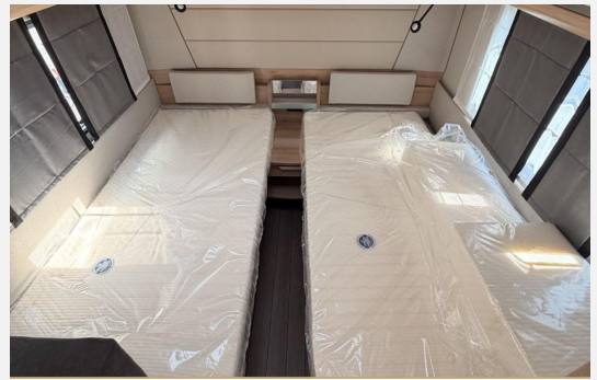
gérard Caravaning 08803 / 63 64-0 info@wohnwagen-gerard.de KNAUS WEINBERG INTER CARAVANNING RENT & TRAVEL FENDT CARAVAN