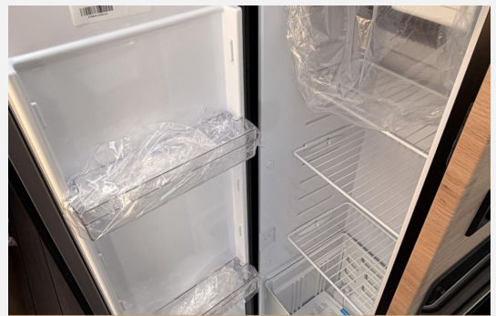
gérard Caravaning 08803 / 63 64-0 info@wohnwagen-gerard.de KNAUS WEINBERG INTER CARAVANNING RENT & TRAVEL FENDT CARAVAN