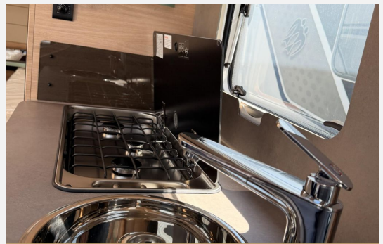
gérard Caravaning 08803 / 63 64-0 info@wohnwagen-gerard.de KNAUS WEINBERG INTER CARAVANNING RENT & TRAVEL FENDT CARAVAN