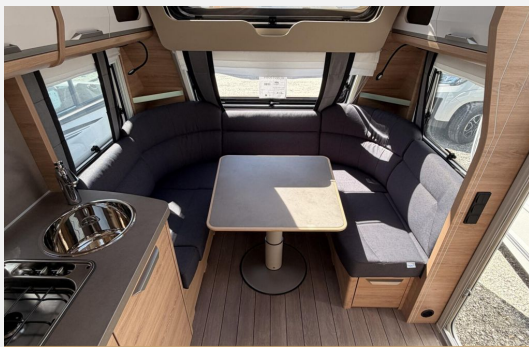
gérard Caravaning 08803 / 63 64-0 info@wohnwagen-gerard.de KNAUS WEINBERG INTER CARAVANNING RENT & TRAVEL FENDT CARAVAN