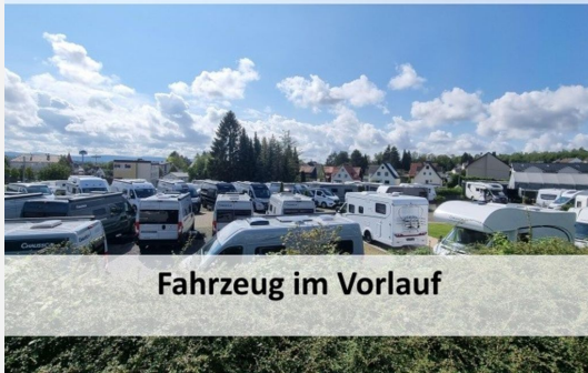
Fahrzeug im Vorlauf