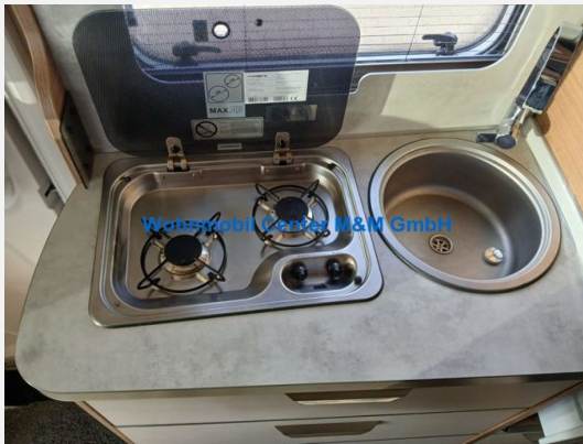
Wohnmobil Center M&M GmbH