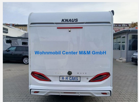
Wohnmobil Center M&M GmbH