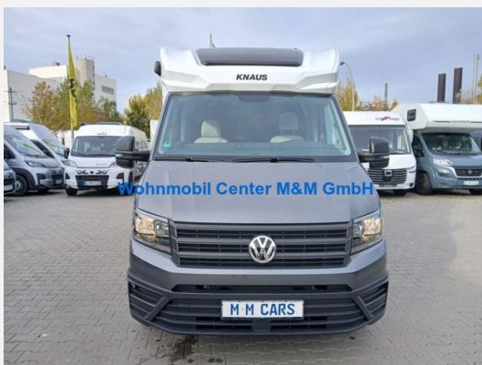
Wohnmobil Center M&M GmbH