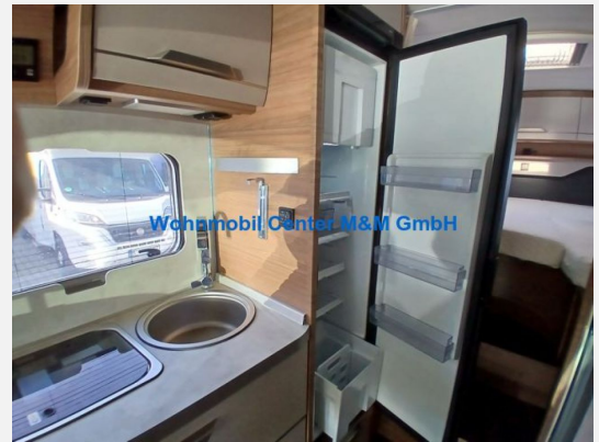
Wohnmobil Center M&M GmbH