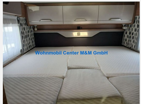
Wohnmobil Center M&M GmbH