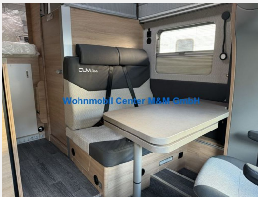
Wohnmobil Center M&M GmbH