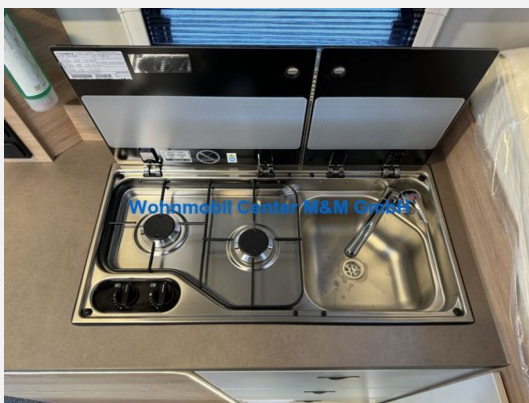
Wohnmobil Center M&M GmbH