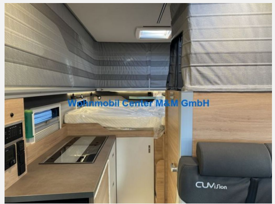
Wohnmobil Center M&M GmbH