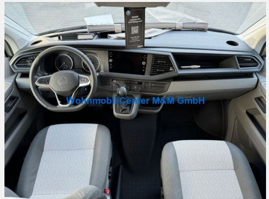
Wohnmobil Center M&M GmbH