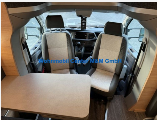
Wohnmobil Center M&M GmbH