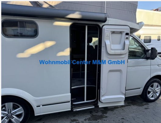
Wohnmobil Center M&M GmbH