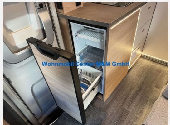
Wohnmobil Center M&M GmbH