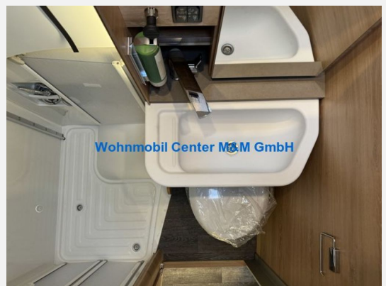
Wohnmobil Center M&M GmbH