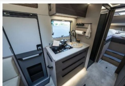
Die Küche setzt auf minimalistisches Design mit einem tiefen Küchenblock mit viel Stauraum. Smart: Zentralverriegelung für alle Schüblchen.