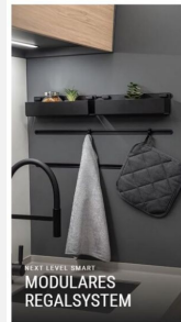
NEU! Einzigartig! MODULARES REGALSYSTEM