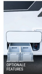
WECHSELN SIE SICH DIE OPTIONALE FEATURES