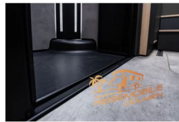
besonderem Komfort- und Design-Feature im Raumboot des FRANKIA NOCTRA: die