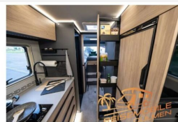
Stauraum-Lösung in der Küche des FRANKIA NOCTRA – durch den räumlichen Apothekerauszug und große Schublader.