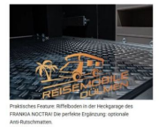
Praktisches Feature: Riffelböden in der Heckgarage des FRANKIA NOCTRA die perfekte Ergänzung optionaler Auto-Bauschuttmatten.