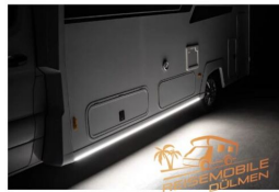
Einzigartig! Optionale Unterbodenbeleuchtung auf beiden Seiten des FRANKIA NOCTRA – perfekt als Ambientebeleuchtung am Abend.