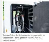
Stauraum? Oh in der Heckgarage, im Innenraum oder im Doppelboden – davon gibt es im FRANKIA NOCTRA mehr als genug.