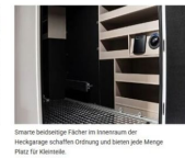
Smarte beidseitige Fächer im Innenraum der Heckgarage schaffen Ordnung und lassen jede Menge Platz für Kleinteile.