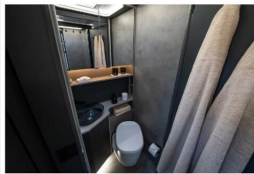
NOCTRA revolutioniert das FRANKIA Sanitarrad mit einem völlig neuem Design und