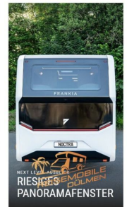
NEU! Einzigartig! REISEMOBILE DÜLMEN: RIESIGES PANORAMAFENSTER