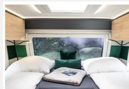
Besonders im Loungegrund: riesiges Panoramafenster über den Liegeböden im FRANKIA NOCTRA (optional).