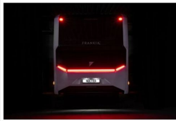
Revolutionär: neu entwickeltes Heck mit Statement Optik, durchgehendem BridgLight und optionaler Propanwanne.