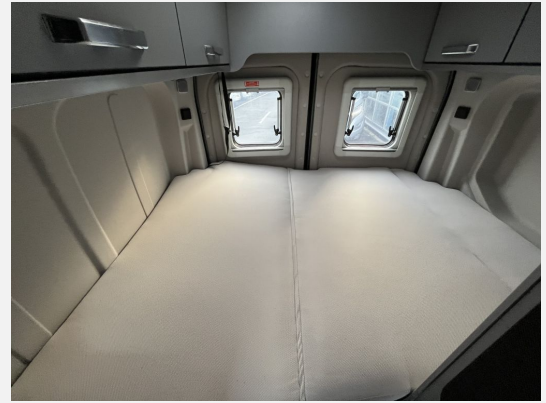
Umbau Sitzgruppe zu Notbett