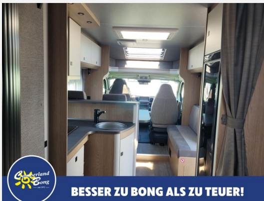
BESSER ZU BONG ALS ZU TEUER!