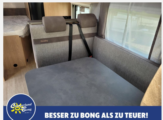
BESSER ZU BONG ALS ZU TEUER!