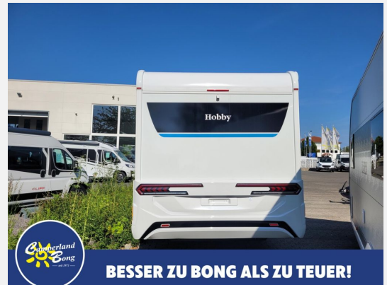
BESSER ZU BONG ALS ZU TEUER!