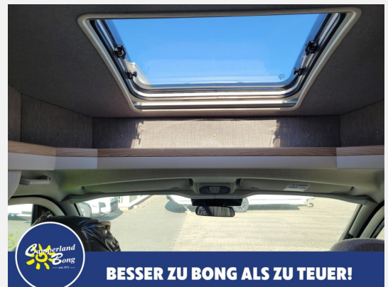
BESSER ZU BONG ALS ZU TEUER!