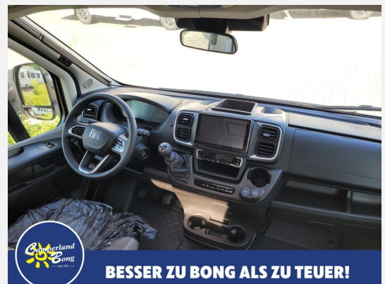
BESSER ZU BONG ALS ZU TEUER!