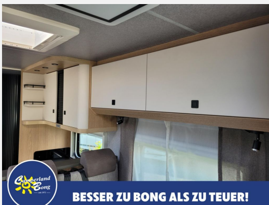
BESSER ZU BONG ALS ZU TEUER!