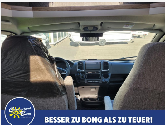
BESSER ZU BONG ALS ZU TEUER!