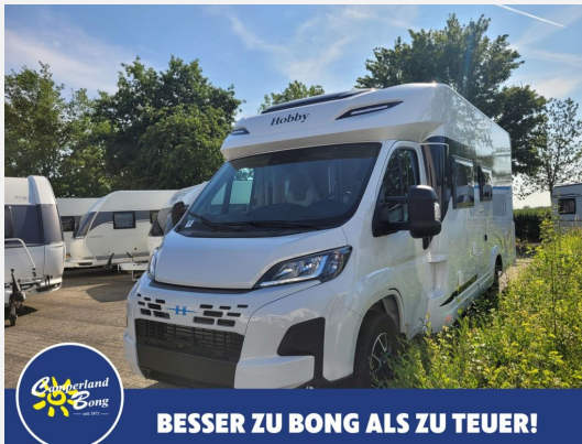
BESSER ZU BONG ALS ZU TEUER!