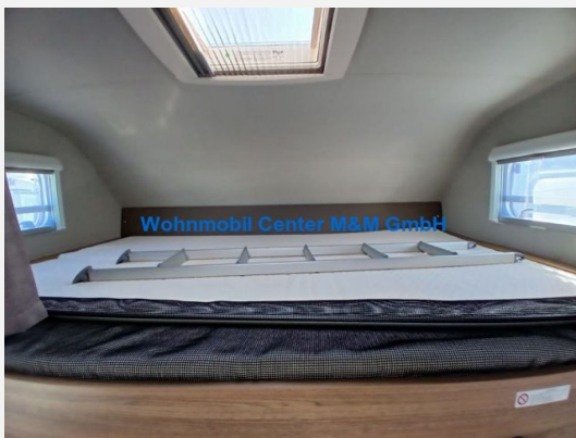
Wohnmobil Center M&M GmbH