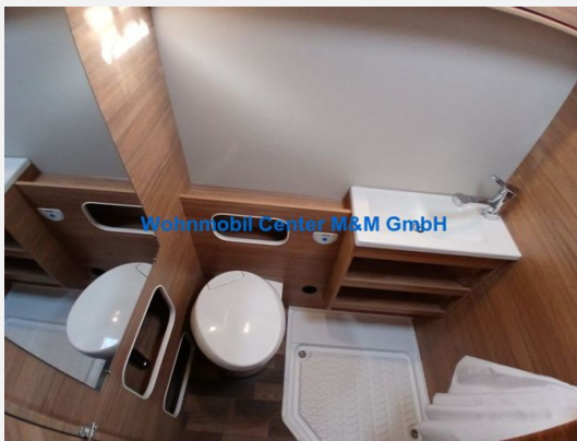
Wohnmobil Center M&M GmbH