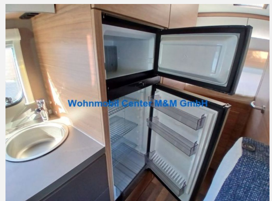
Wohnmobil Center M&M GmbH