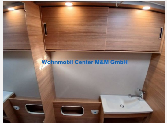
Wohnmobil Center M&M GmbH