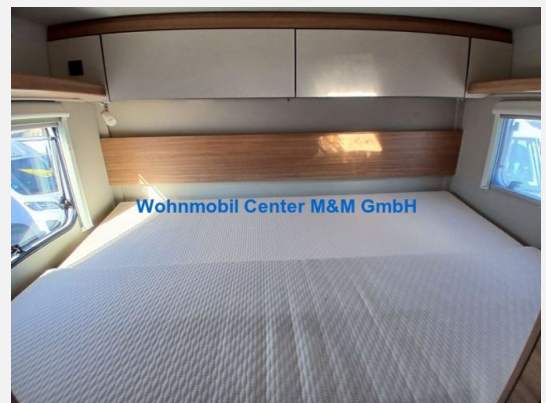
Wohnmobil Center M&M GmbH