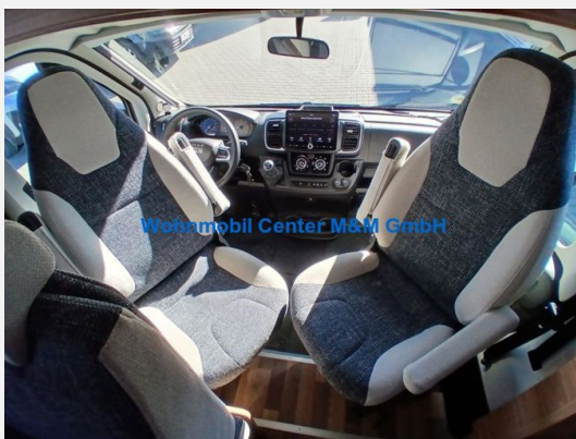
Wohnmobil Center M&M GmbH