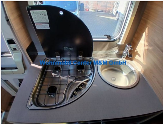
Wohnmobil Center M&M GmbH