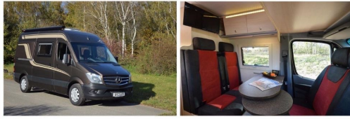
MERCEDES BENZ SPRINTER BRESLER 591 DF