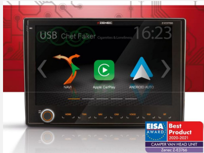
Z-E3766 Fahrzeugspezifischer Naviceiver Für FIAT Ducato III | CITROËN Jumper II | PEUGEOT Boxer II