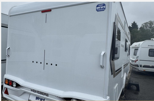
gérard Caravaning 08803 / 63 64-0 info@wohnwagen-gerard.de KNAUS WEINSBERG INTER CARAVANNING RENT OF TRAVEL FENDT CARAVAN