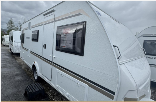
gérard Caravaning 08803 / 63 64-0 info@wohnwagen-gerard.de KNAUS WEINSBERG INTER CARAVANNING RENT OF TRAVEL FENDT CARAVAN