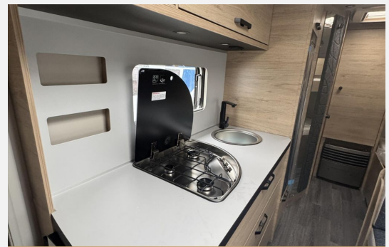
gérard Caravaning 08803 / 63 64-0 info@wohnwagen-gerard.de KNAUS WEINSBERG INTER CARAVANNING RENT OF TRAVEL FENDT CARAVAN