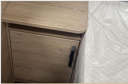
gérard Caravaning 08803 / 63 64-0 info@wohnwagen-gerard.de KNAUS WEINSBERG INTER CARAVANNING RENT OF TRAVEL FENDT CARAVAN