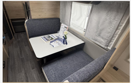
gérard Caravaning 08803 / 63 64-0 info@wohnwagen-gerard.de KNAUS WEINSBERG INTER CARAVANNING RENT OF TRAVEL FENDT CARAVAN