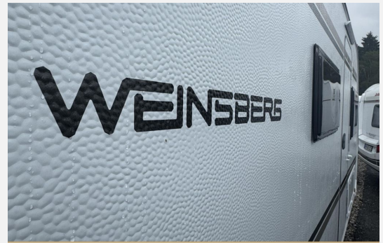
gérard Caravaning 08803 / 63 64-0 info@wohnwagen-gerard.de KNAUS WEINSBERG INTER CARAVANNING RENT OF TRAVEL FENDT CARAVAN