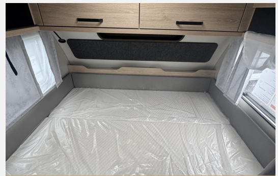
gérard Caravaning 08803 / 63 64-0 info@wohnwagen-gerard.de KNAUS WEINSBERG INTER CARAVANNING RENT OF TRAVEL FENDT CARAVAN