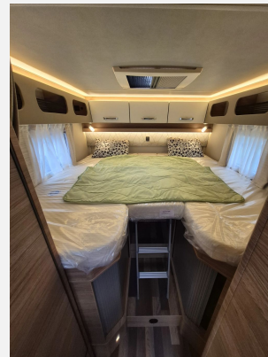
EvoPore HRC Matratze inkl. WaterGEL-Auflage, nur Festbetten