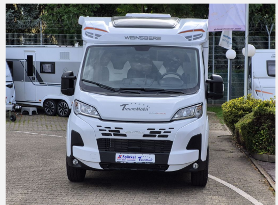
Voll-LED-Frontbeleuchtung (Ablend-, Fern- und Blinklicht)