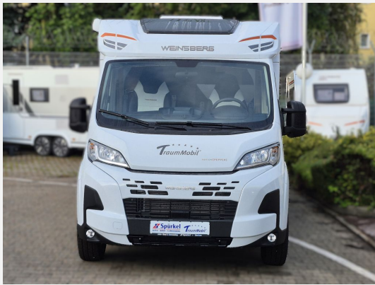
Voll-LED-Frontbeleuchtung (Ablend-, Fern- und Blinklicht)