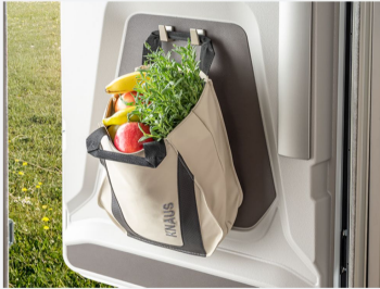
Multifunktionale Tasche im KNAUS Design