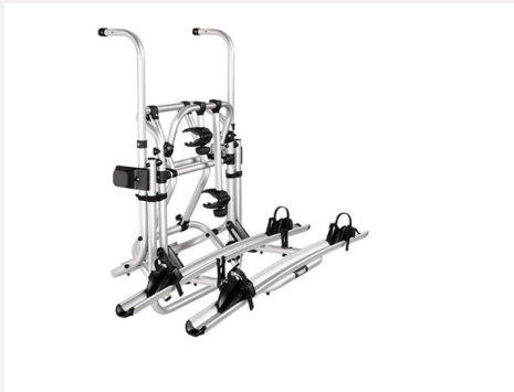
Fahrradträger für 2 Räder, Heck: THULE LIFT V16

Das Armaturenbrett Techno zeichnet sich durch eine silberne Verkleidung der Lüftungsdüsen aus.