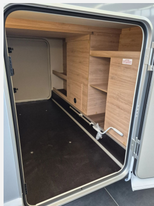
Fahrradträger für 2 Räder, Heck: THULE LIFT V16