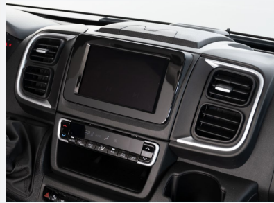
Instrumententafel im Techno-Design (Alu)

Das Armaturenbrett Techno zeichnet sich durch eine silberne Verkleidung der Lüftungsdüsen aus.