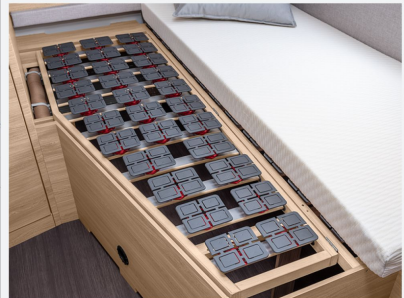
Mit der WaterGEL-Auflage wird Ihr Schlaferlebnis auf unserer EvoPore HRC Matratze noch besser.