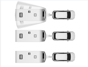
AL-KO Trailer Control-ATC – Anti-Schleuder-System (2.0)

Das Anti-Schleuder System von AL-KO • verhindert Schlingerbewegungen und gefährliche Aufschaukeln des Gespannes Das Bremsen erfolgt • sanft, aber für den Fahrer spürbar • erfolgt ohne Aufleuchten der Bremslichter