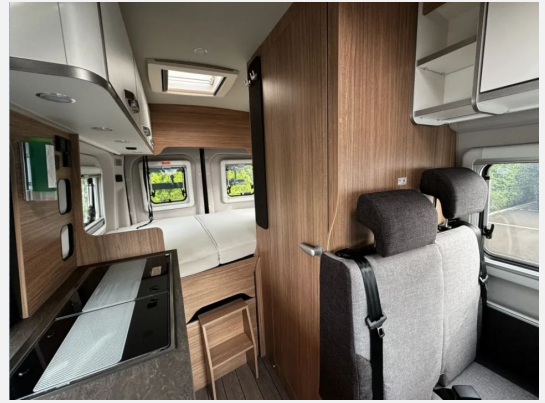
Umbau Sitzgruppe zu Notbett