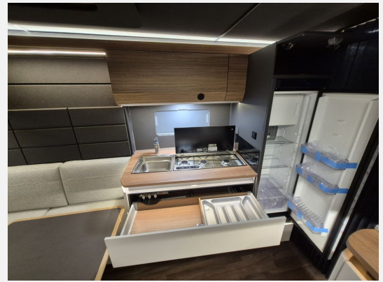
Aufklappbare Arbeitsplattenverlängerung an der Küche in der Smart-Wall